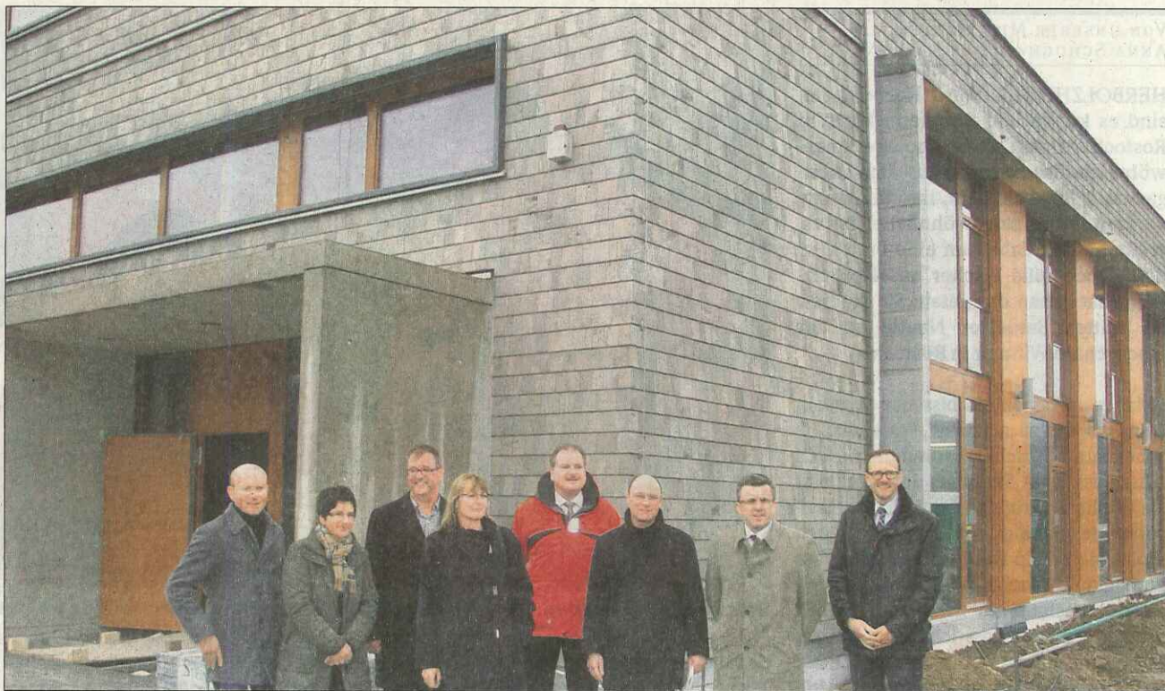
Das Bauherreninformationszentrum BIZZZ im Gutacher Gewerbegebiet Stollen wird am 20. Januar offiziell und am 21./22. Januar mit zwei Publikumstagen eröffnet. Hier Vertreter der Regiowerk, des Vereins Bauinformationszentrum, von Sparkasse, Volksbank und Stadtwerken vor dem neuen Haus im „Stollen“.

In der ersten Ebene werden Informationen rund um die Vorbereitung eines Häuslebaus geboten – von der Beantwortung